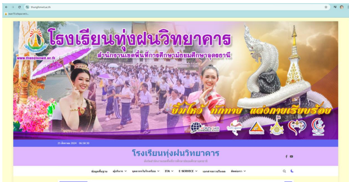
ภาพเว็บไซต์โรงเรียนทุ่งฝนวิทยาคาร

- โรงเรียน มีเว็บไซต์ที่ทันสมัย และใช้เป็นแหล่งเชื่อมต่อให้กับแอปพลิเคชันต่าง ๆ จากหน่วยงานอื่นที่เป็นประโยชน์ต่อบุคลากรและประชาชนทั่วไป