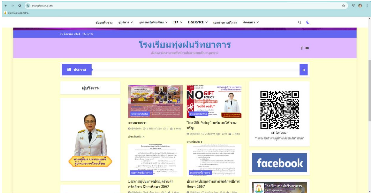
ภาพเว็บไซต์โรงเรียนทุ่งฝนวิทยาคาร