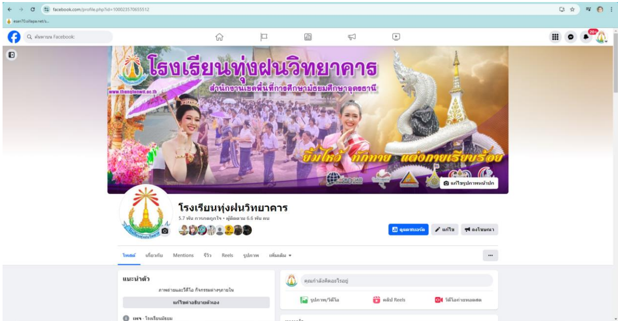
ภาพเพจเฟสบุ๊คโรงเรียนทุ่งฝนวิทยาคาร